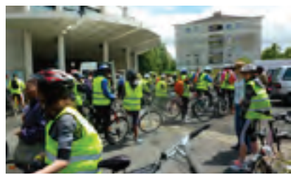
Camp vélo 2015